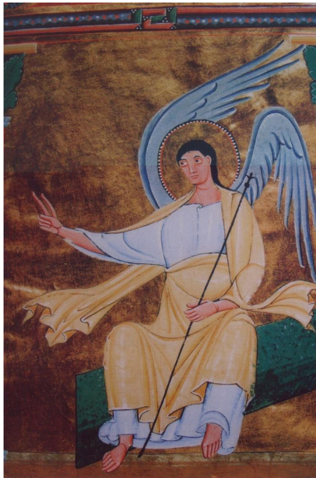
Noch vom Anflug bewegt: Der Verkündigungengel aus dem Perikopenbuch Heinrichs II.

Nicht gerade die Originale der zum Weltkulturerbe erklärten mittelalterlichen Handschriften, wohl aber ihre in einer Kombination von neuer Technologie und alter Handwerkskunst entstandenen Faksimiles sind in einer überwältigenden Fülle im Städtischen Museum noch bis zum 18. Juli zu sehen. Das Perikopenbuch Heinrichs II., der Evangeliar Heinrichs des Löwen und Karls des Großen liegen aufgeschlagen im Duesberg-Saal bereit zum Durchblättern ja, sogar zum Durchblättern! Zu danken ist es dem Sammler Siegfried Loob, der seine Schätze in uneigennütziger Weise interessierten Besuchern des Museums zur Betrachtung überläßt. Die Ausstellung ist Die bis So von 10-17, Donnerstag sogar bis 19 Uhr, geöffnet, bei freiem Eintritt!